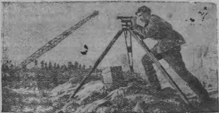
Суред вылын: Днепро-Бугской каналэн 10-тй гидроузлаз строительствон.

Белоруссиись западной областьёсаз 202 километр'ем Днепро-Бугской каналэз лэсьтон мынэ. Канал герзалоз судоходной Буг шурез Днепрэн но Черной мораен.