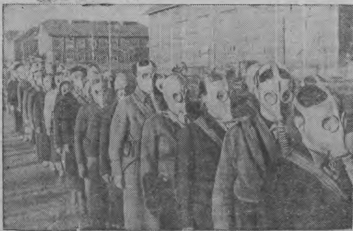
Суред вылын: Осовахиимовец'ёслэн колонназы поход азын.

Карельской АССР-ысь, Пряжинской районьсь ВЛКСМ райкомез но осовахиимлэн райсоветэз противогаз'ёсын 4 километр'ем поход организовать карызы. Походын Пряжа селосы 80 егитэсь осовахиимовец'ёс участвовать карызы.