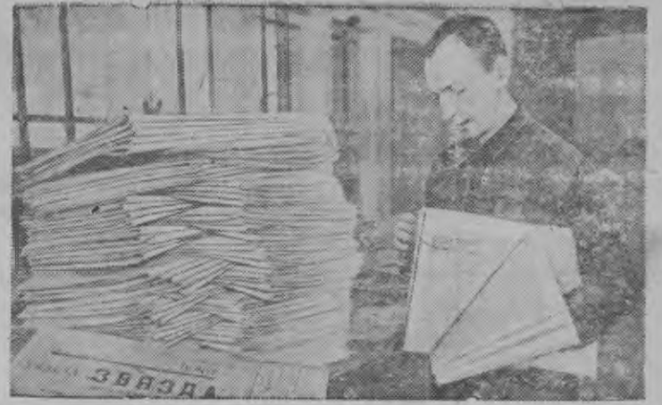
Суред вылын: Баранович городы ын чтамтээн эксецицияз виль газет'ёсты селоосы но гв'ёт'ёны ке яны люкы э