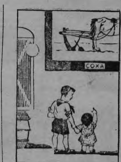
—Ма со сыче? Со а... со... кызьы тынды вераны? Со дореволюционной тракт- тор!

Красной Армилен танковой частьёсыз Ковель городэз басьтыса азылань кошкэм бе- ре, уйин татчы куинь красно- армеец'ёс вуизы. Соосын вал че ик отделенилен команди- рез Халачень эш вал. Соос главной колоназылэсь люкись килос. Города доры вуыса, соос пумиськызы польской солдат'ёслэн отрядэнызы. отын ик вал полковник но, Соосын ваче жугиськыны