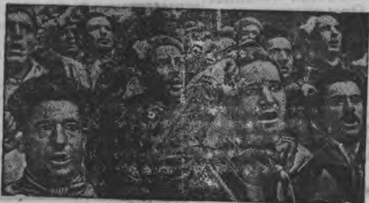
Суред вылын: Интернациональной бригадысь боец'ёс, Республиканской Испанияысь кошкысьёс, Барселоналэн ульчаёт'ыз ортчо.

25 метр'ем мурдалаысь жутэм но Одесской портэ доставить карем „Петр Великий“ товаро-пассажирской парох доржавчиналэсь, ракушкалэсь но иллэсь сузян но пароходлэсь корпусэз красить карон мынэ.