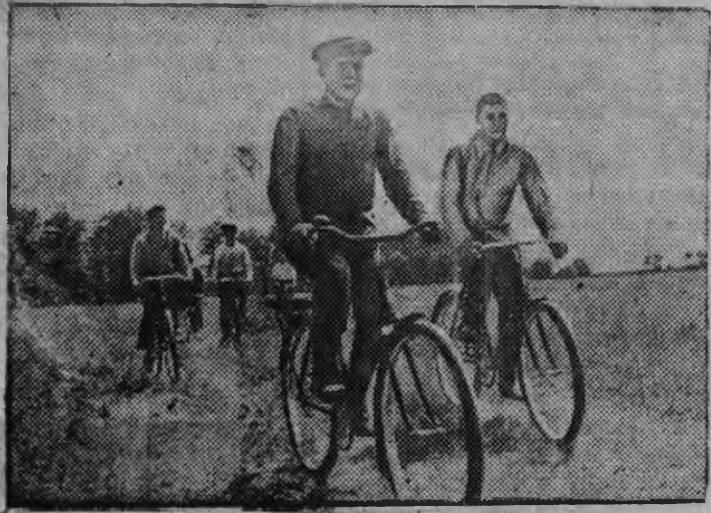
Суред вылын: Чапаевлэн нимыныз нима колхозысь колхозник'ёс (Средне-Ахтубинской район, Сталинградской область) велоэкскурсын.