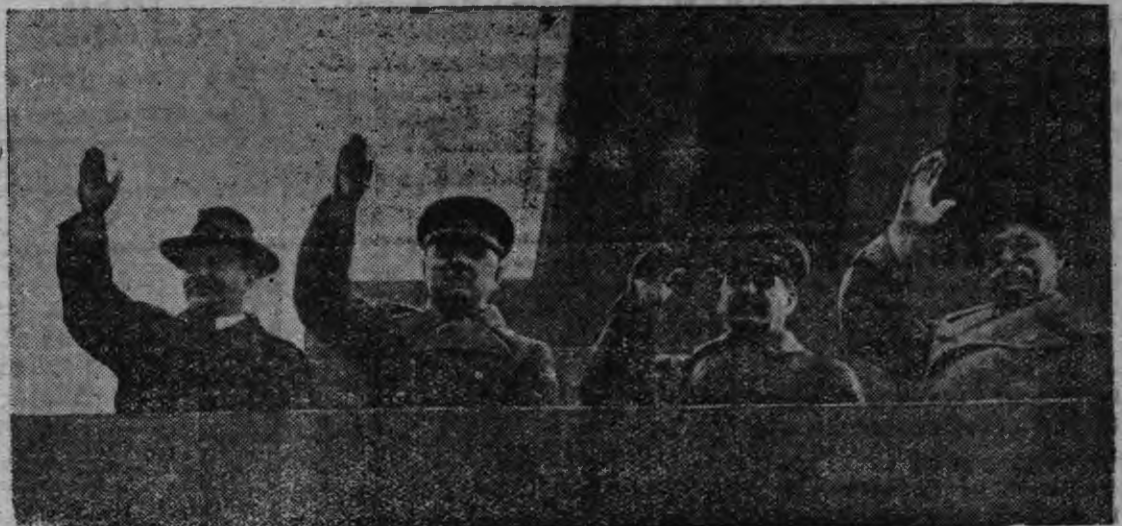
Бурисен палляне—Ярославский, Сталин, Ворошилов но Молотов эш'ёс мавзолейлэн трибуна вылаз.

Москваын Первой Маез праздновать карон. Красной площадын трудящойёслэн демонстрацизы