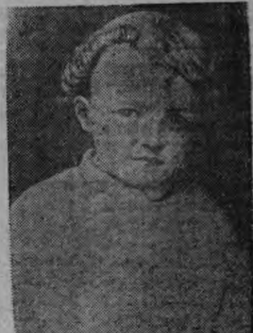
В. И. Ленин 4 арес дыр'яз

тодо колхоз'ёс сярсь великой сталинской сюлмаськонэз но Сталинлы отвечаг каро вискарытэк яратонэн но преданностэн.