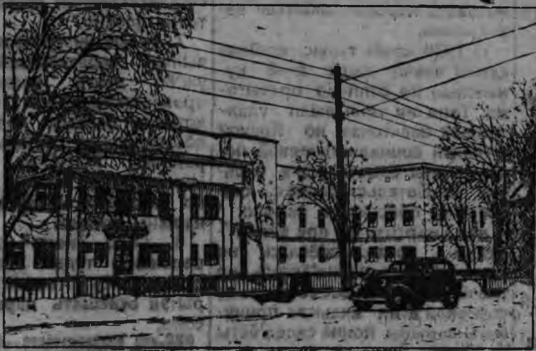
Петрозаводскысь С. М. Кировлэн нимыныз нимем урамась родильной корка.

СССР-ысь город'ёсын. Карельской АССР-ысь Петрозаводскын виль родильной корка усьтйське.