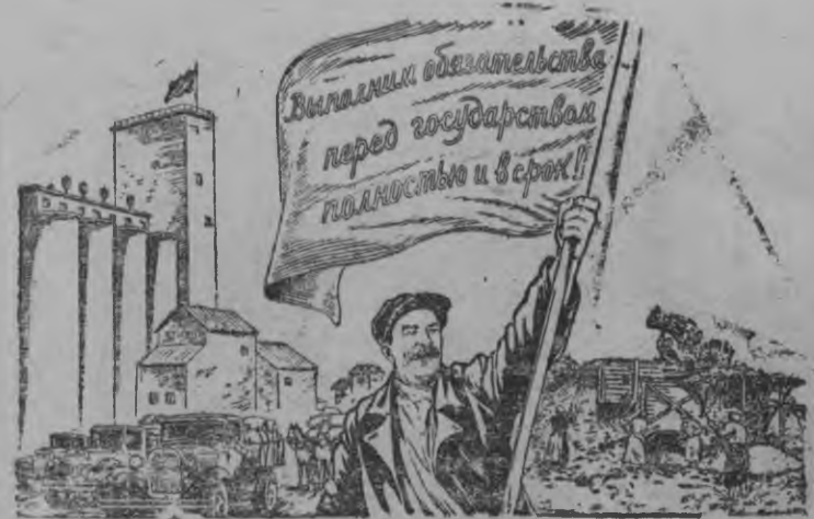
В. Барковлэн но В. Лисевичлэн рисуноксы.