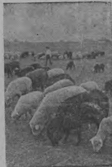
„Железнодорожник“ колхозлэн ыж'ёсыз пастбищын.

Воронежской областысь Таловской районьн „Железнодорожник“ колхозлэн ыжвордон фермаез 1940 арын ВСХВ лэн участникез. Фермаын зöк выжы „Прекоз“ 985 ыж'ёс. Туэ арын одйг ыжлэсь 2,5-3 килограмм гонзэс чышкизы.