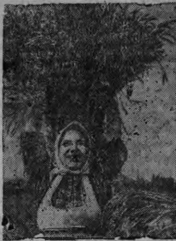
Суред вылын: Всесоюзной Сельскохозяйственной Выставкаез усътон азелы Н. Скурихин художникен лэстыэм плакатэз „Искусство“ издательствэен поттэмын.