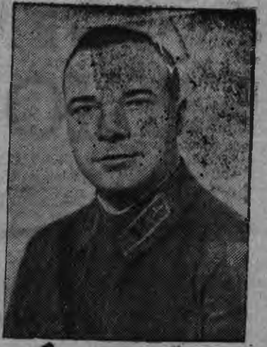
Суред вытын (палаянысен буре): Советской Союзлэн Героез В. К. Коккицаки но „Москва“ самолетлэн штурманез Майор М. Х. Гордиенко