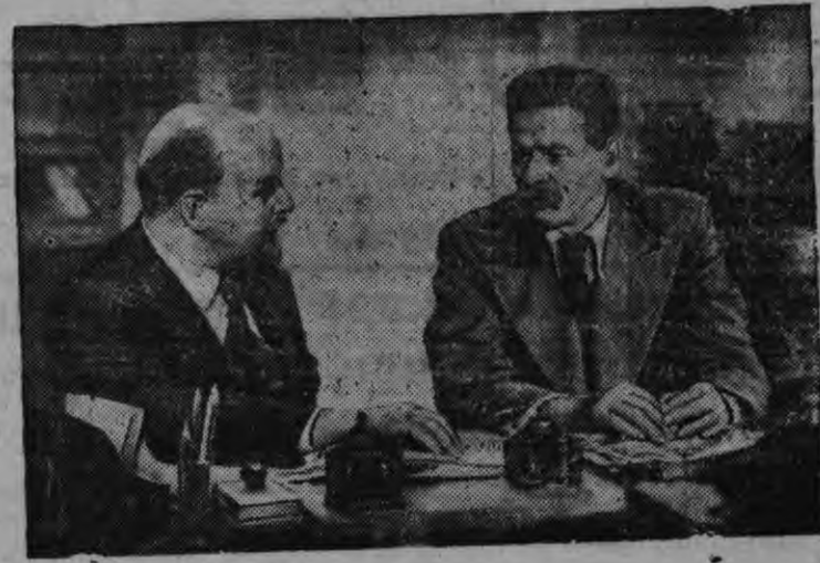
Суред вылын: Ленинлэн аслаз кабинетаз Максим Горькийен вимтаське (встреча) Ленинлэн роляз СССР-ысь народной артист, орденоносец Б. В. Щукин. Горькийлэн ролы СССР-ысь заслуженной артист орденоносец Н. К. Черкасов.

Мосфильм киностудиен художественной, историко-революционной фильм "Ленин" производствоен быдэстэмын. Со "Ленин в октябре" кинофильмлэн продолжениез луэ.