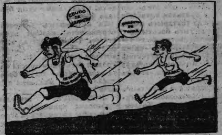
Бело-фин'еслэн пблн'я мировой „рекорды“

Кытэ'йез Германской самолет кык английской самолет'есын атаковать каремын вал, со пилем'ес сьбры паткыса пегзыны быгатыз“.