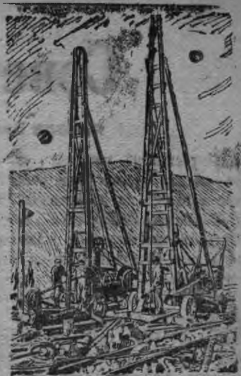
СУРЕД ВЫЛЫН: Аммоналэн рудаосы взрывать карыны понна скважинаосы даян бордын бурильной станок'ёс (Ленинградской областысь Кировскысь апатитовой рудник).