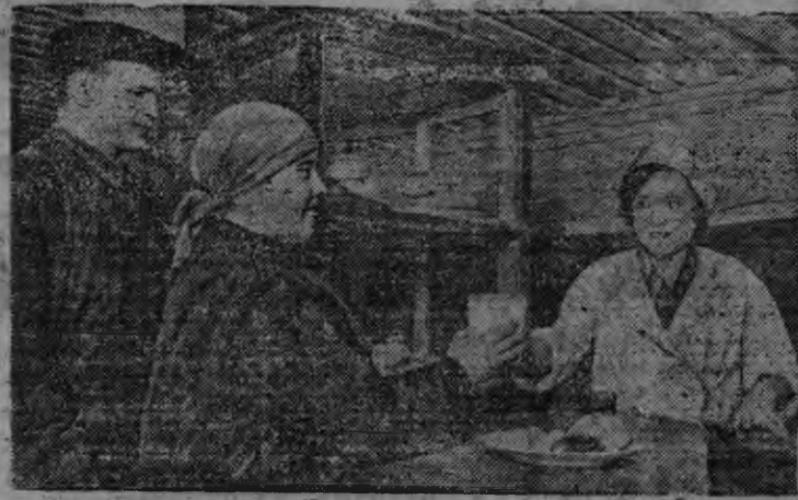
Суред вылын: Кировлэн нимыныз нима апатит рудниклэн подземной буфетаз.

31 декабре 10 ар тырме Кировск городын (Мурманской область) СССР-лэс апатитовой промышленностез-лэс центрээ кылдытон нуналысен.