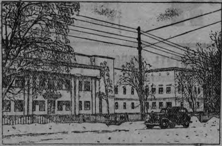
Суред вылын: Петрозаводскысь (Карельской АССР), С. М. Киров ульчаысь выль пинал ваён корка.