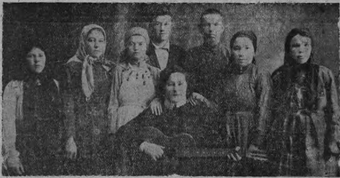
СУРЕД ВЪЛЫН: „Удмурт“ заводьсь ужасьёслэн удмурт хорзы.

Процессэ городысь но районьысь уно калык люкасыкиз. Судлэн Чулна заседаниез обвинительной заключениез лыдженэн но янгыш луис