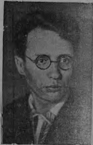
Суред вылын: М. И. Панкрат'ев, кудйз СССР-лэн Верховной Советэзлэн III-тй Сессиеныз утвердить каремын СССР-лэн Прокурореныз.

Пинал'ёс али валэс юос пöлысь жаг турынез уронэз переключить каремын. Б.