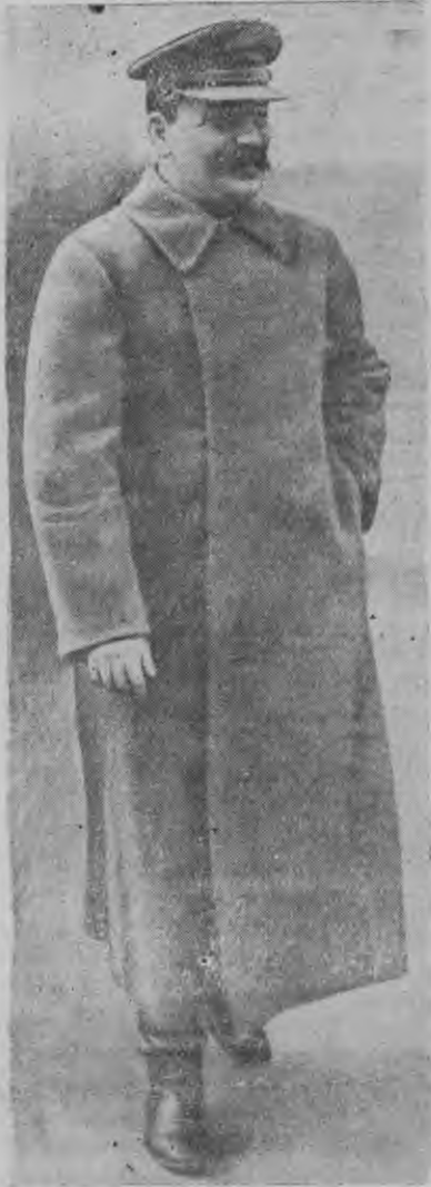
И. В. Сталин 1 мае 1935 арын мынэ Красной площади.

Нырысетй революцилэн ар'ёсаз (1805—1907 ар'ёс) Сталин эш— Ленинлэн матысь соратникез, Закавказиысь большевик'ёслэн, революционной рабочийёслэн но крес-