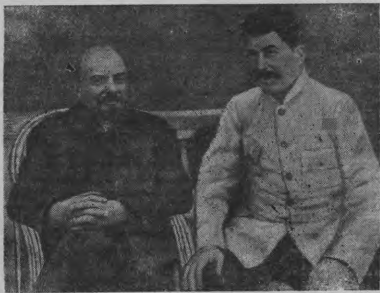
В. И. Ленин но И. В. Сталин Горкаын (1922 арын).