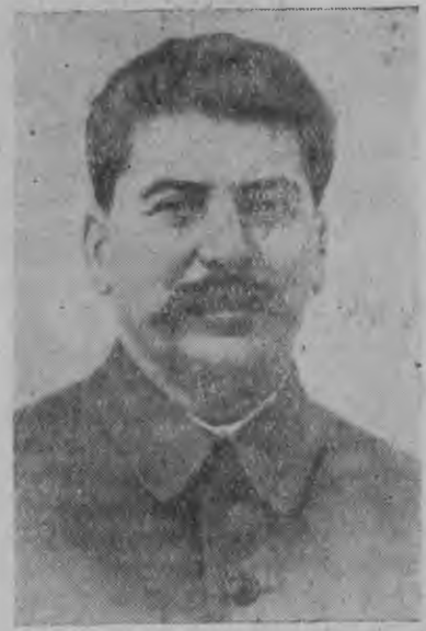
И. В. Сталин.

Сталин эшлэн кивалтэм улсаз СССР-ысь калык'ёс социализм лэсьтонэз в основном быдэстыса, коммунизме переходить каре. Ста-