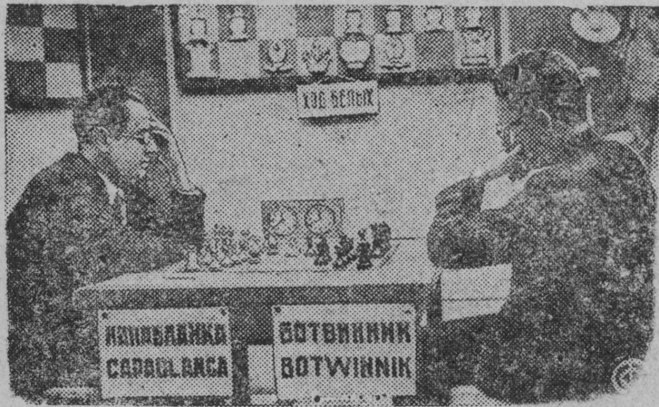
НА СНИМКЕ: Чемпион СССР М. Ботвинник и гроссмейстер Капабланка.

Результаты его таковы: первый и второй призы поделили чемпион СССР М. М. Ботвинник и чемпион Чехословакии С. Флор , набравшие по тринадцать очков из девятнадцати возможных. Третий приз получил бывший чемпион мира доктор Э. Ласкер , набравший 12,5 очков. Четвертый приз завоевал бывший чемпион мира Х. Р. Капабланка —12 очков и пятый—гроссмейстер Р. Шпильман —11 очков. 6-й и 7-й поделили Левенфиш и Кан (по 10,5), 8-й, 9-й и 10-й— Романоский, Лилленталь и Рагозин (по 10). За ними— Рожин, Алаторцев, Гоглидзе и Рабинович (по 9,5).