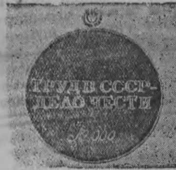
ОБОРОТНОЙ СТОРОНАЕЗ.