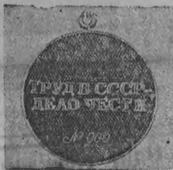
ОБОРОТНОЙ СТОРОНАЕЗ