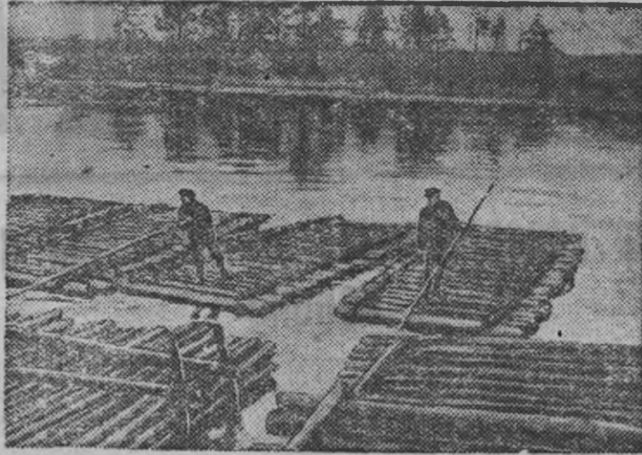
Межное нюлэс пристаньын (Вологодской область, Череповецкой район).

Асьме районуын 1919 арын вордскем граждан'ёслы призывной участок'ёсы гожтон 28 но 29 июле луоз.