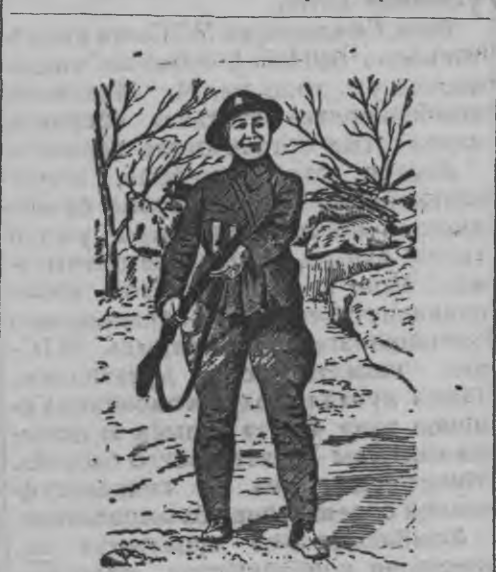
Суред вылын: Китайысь кышномурт. Армие со добровольно мынйз.

Сучжоысь одйг кышномурт, китайской воинской поезд'ёслэн ветлэмзы сярсь японец'ёслы информировать карыса улэмез понна, аслэсьтыз картэс выдать кариз. Со кышномурт, картэс сыче предательской уждлэсь дугдыны косыса улиз. Солэн верамез юрттымтэ бере, картэзлэн шпионить каремез сярсь китайской властьёслы вераз со. Шпионез властьёс ыбизы. Собере со нылкышнолэсь иськавын'ёсыз юало, карттэ жаласькод-ашуыса. Со вера, мон катме предателез ышты ке но, со понна асьме странаысьтымы трос граждан'кады кужмо армиез би на вал. Тини солы оскыса кутскизы японской агрессор'ёс. Китайской компартилен инициативаез'я армия али умой вооружить каремын, пазыськем отряд'ёс огазеяськыса, кышкыт но зол кужымлы пөрмемын.