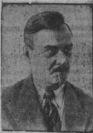
СУРЕД ВЫЛЫН: РСФСР-лэн На-родной Комиссар'ёсызлэн Советсылэн председателез Николай Александрович Булаганин.