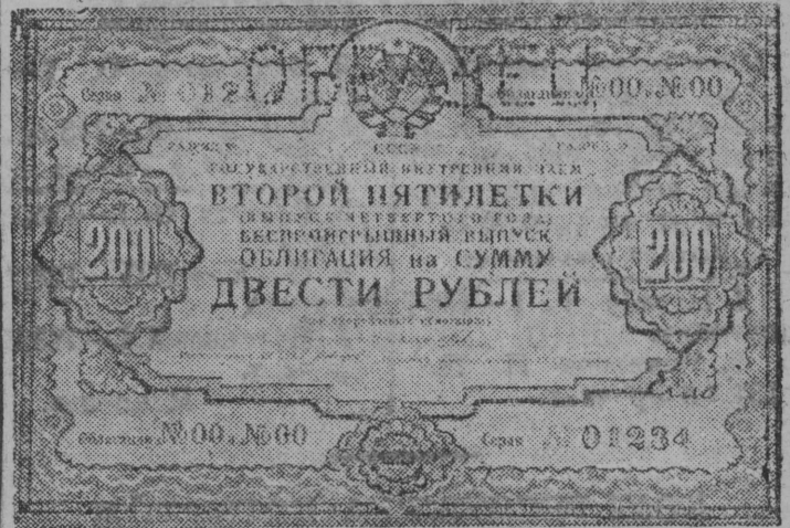
Мѳд Пјатілетка зајомлѳн (нолѳд вѳса выпуск) обраец.