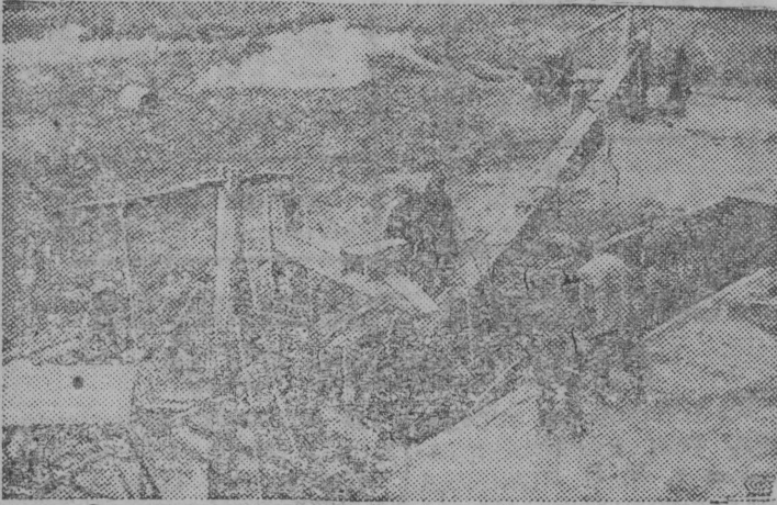
Ўенін німа колхоз Черк ской район, Кіевской област, Ыжыд урожај вёсна. Таво колхоз первёныс паскыда кісталіс шыпосу ваён кёзјас. СЕРПАС ВЫЛЫН: Сооруженіё, кытён храйтёны шыпосув ва (жіжехраніліще).