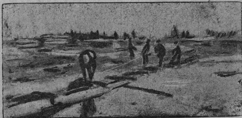
Луз ју „Сталинец“-са колхозникјас вөчөны бонна