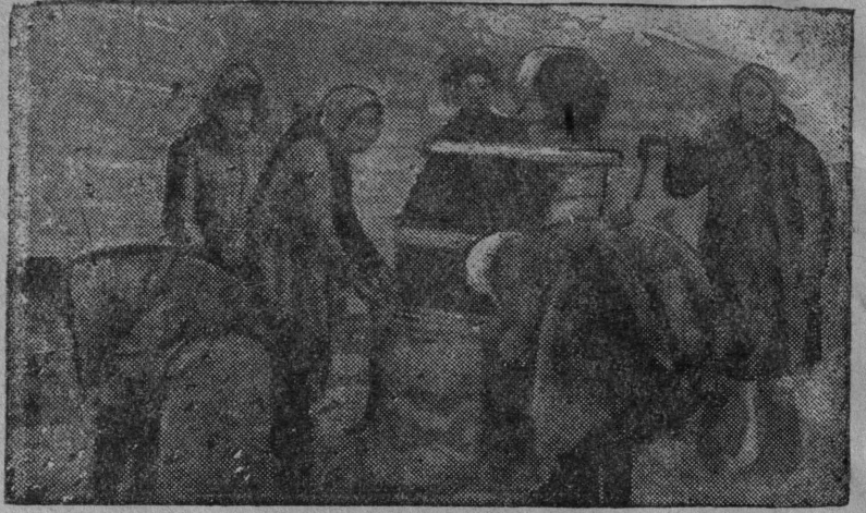
Кліше вьлын: Палын „1-ја пјатилетка“ нима колхозлөн пыр ужалан бригада ударноја весалө кәјдәс.

Пемыдлун бырөдан фронт вылын мај 1-ј лун кежлө тыр вермөм ез-на ло перјома. Област паста мај 1-ј лун кежлө вөлі кыскөма велөдчөмө став неграмотној лыд пыщкыс 12638 морт. На пыс велөдөма і лезөма малограмотној группаө 6491 морт. Малограмотној пыщкыс велөдчөмө кыскөма лоі сөмын 18213 морт. На пыс велөдөма төвбыдөн і лезөма грамотнојөн 8966 морт. Торја районјаслөн колі велөдны сымында јөз: