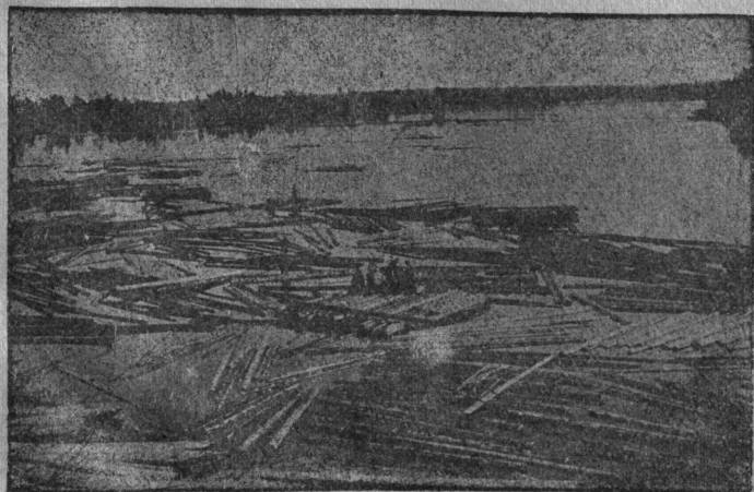
Моллөн вөр кылөдөм