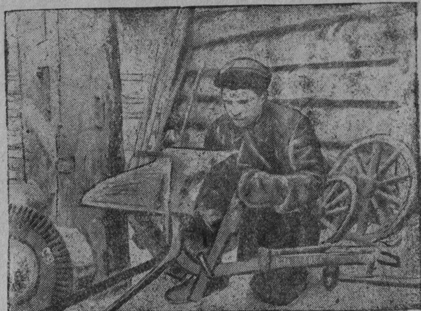
Ремонтүтөны гөра-көза инвентар