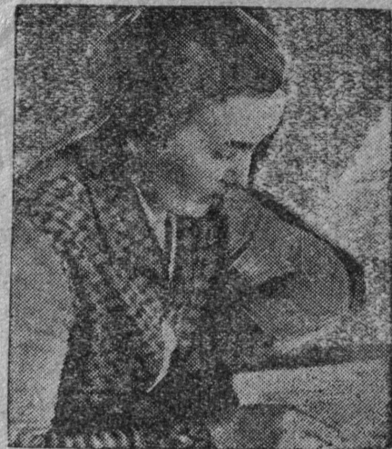
Мысова ушительница ФЗС удар-ница-культурмејка.

6. Көза нуөдиг кежлө колөдөма көрым фонд