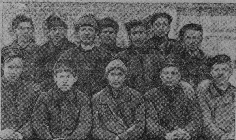
Пөжарнөј камандаса ударникјас, кодјас бырөдiсны неграмотност