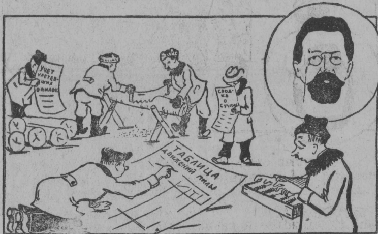
Чехов: Оказывайтчо, ещё эз на быдлаысь переведитчины „лишней йёзьяс“.

Куломдинса леспромхозлөн откымын участокьясын уна йёз уджалисны подсобной уджьяс вылын.