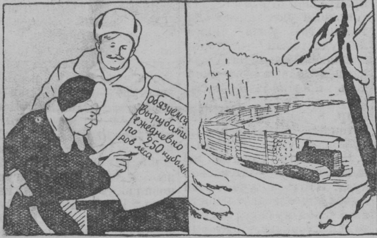
Что написано пером—то и вырублено топором. Рис. Ю. Узбякова.

Торф да куйёд петкё-домкёд тшётш колхозьяс ньёбёны минеральной удоб-рениеяс, „Октябрьской по-беда“ колхоз ньёбис нин 10 тонна, „Свобода“ колхоз—6 тонна, „Ындін“ колхоз—4,5 тонна, Ленин нима кол-хоз—4 тонна. Ставсё сель-хозснаб вузалис 35 тонна. В. ЕФИМОВИЧ.