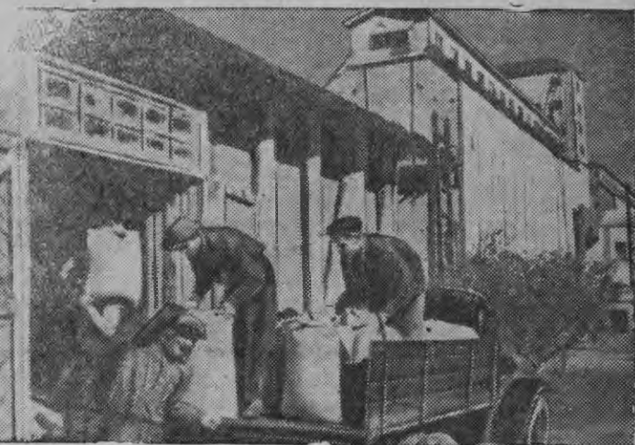
Александровской элеват рын. Колхозник'ёс сгружать кароасьсэ машинаен ваем чабей'эс.

„Ленинский путь“ колхоз (Сталинградской область) государстволы зег но йды сётонэз быдэстыса, кутскиз яровой чабей сдать карон борды.