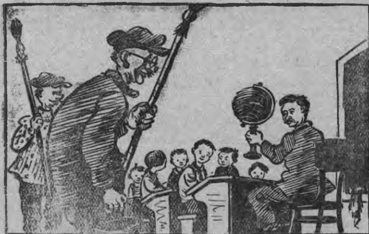
—Дышетись эш! Отелэ доска доры кыкэз ученик'эстэс, со куспын ми партаез красить каром...