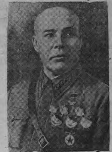
СССР-ысь Обороналэн Народной Комиссарез, Советской Союзлэн Маршалэз, Советской Союзлэн Героез С. К. Тимошенко.

С. К. Тимошенко назначить каремын СССР-ысь Обороналэн Народной Комиссареныз.