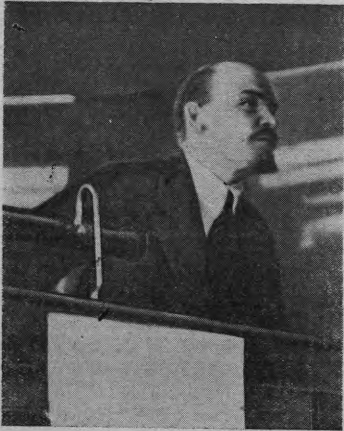
В. И. Ленин Коминтернлэн кыктэти Конгрессаз (1920 арын)