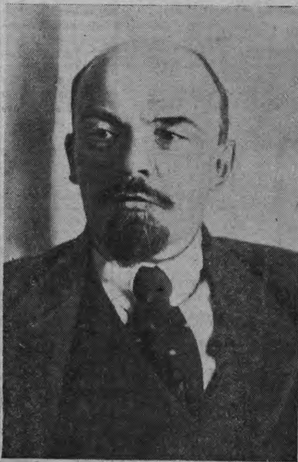
В. И. Ленин.