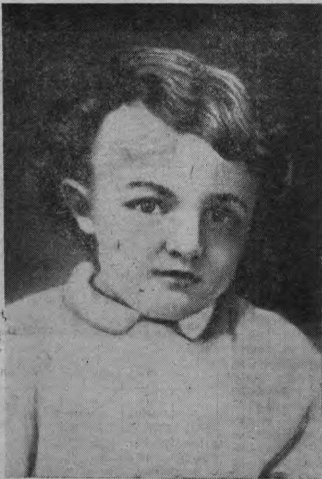
В. И. Ленин 4 арес (1874 арын).

Быдэс дунне чуз'ясыкыз Сталин эшлэн клятвас, кудзэ со сэтйз вождылэн гробез дорын. Сталин эш большевистской партилэн нимыныз клятва сэтйз свято возыны но улонэ шыртыны кулонтэм ленинской идеостм. Та клятва тйэськытэе