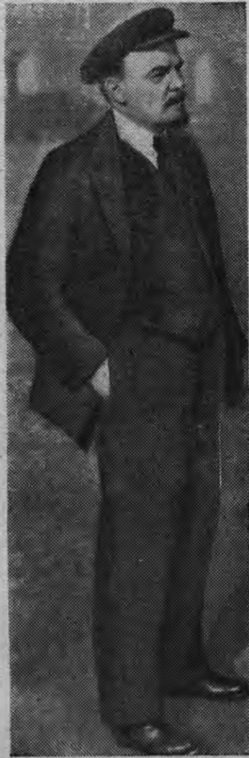
В. И. Ленин Кремльлэн азбараз прогулкаын (1918 ар. Москва).

Петроградэ лыктыса, вань «мылкы-даныз революционной уже сётсье-меныз, та комнатае улыны лыктйз август толэзе гинэ.