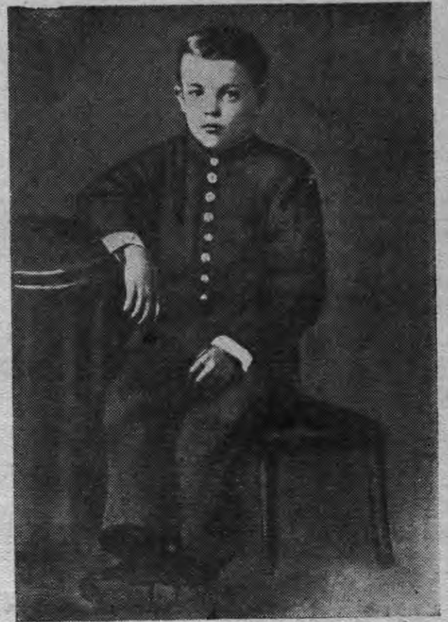
В. И. Ленин — 1-ти классысь гимназист (1879 арын)