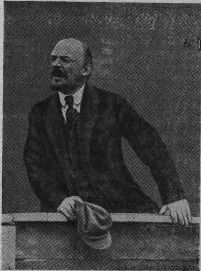
В. И. Ленин погьской фронтэ мынысь красной боец'ёслы Свердловлэн площадысьеныз речь вера. (Москва, 1920 арын).