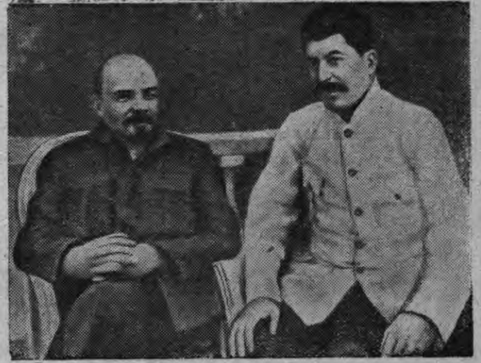
В. И. Ленин но И. В. Сталин Горкаын (1922 арын)

Ленинлэн—Сталинлэн партиез, калык та указаниез свято быдэс'яло. Арысь-аре будэ но юлма социализм странаалэн вооруженной кужымез, Борысь ар'ёсы противник'ёсын столкновениосын, Красной Армия но Военно-Морской Флот