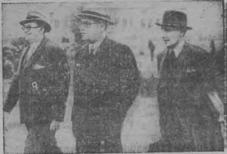
Альварес дель Вайо, Негрин но Хираль Лига Нацплэн дворецезлэн садаз

Испаниясы делегация Лига Нацилэн Пленумаз.