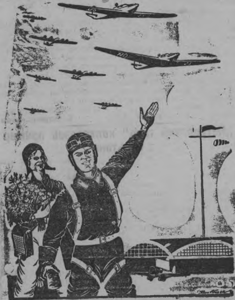
Дано мед луоз Советской Авиация!