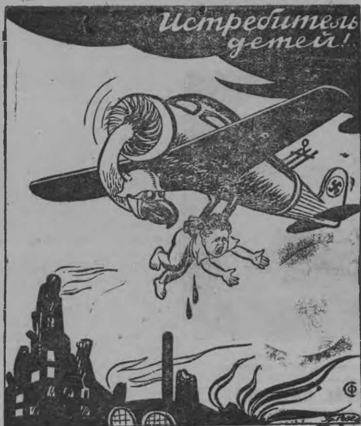
Фашистской авиацион ымнырыз.