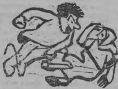
ХАРИН: „Дышод али нылкышно право сярхьсь вераськыны!“

Сталинской Конституция тужгес но нылкышноослэсь правозэс юнматэ. Удмурт АССР Конституцилэн 87 статьяз „нылкышнолы хозяйствен-ной, государственной но общ-ественно-политической улоп-лэн вань обласьёсаз пиос-муртэн огкадэсь правоос сёт-исько...“ шуса верамын.