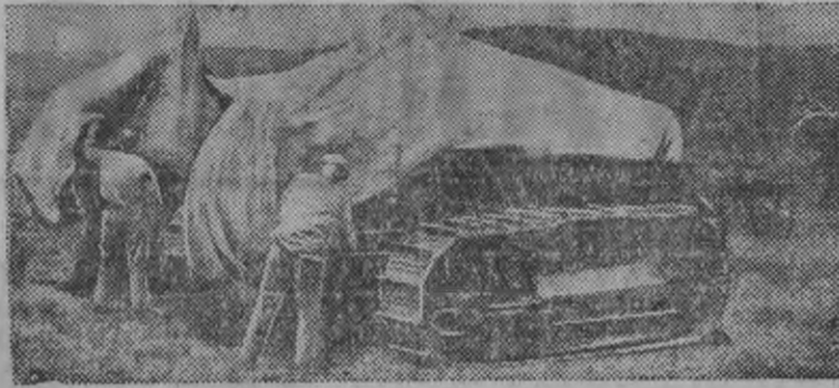
СУРЕД ВYЛЫН: Азово-Черноморской крайысь, Старо-Минской МТС-ысь тракторист'эс тракторез брезентэн шобьрто.