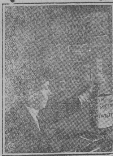
НА СНИМКЕ: Бригадир колхозник отпскает заметку в ящик для стенгазеты "Лесоруб".