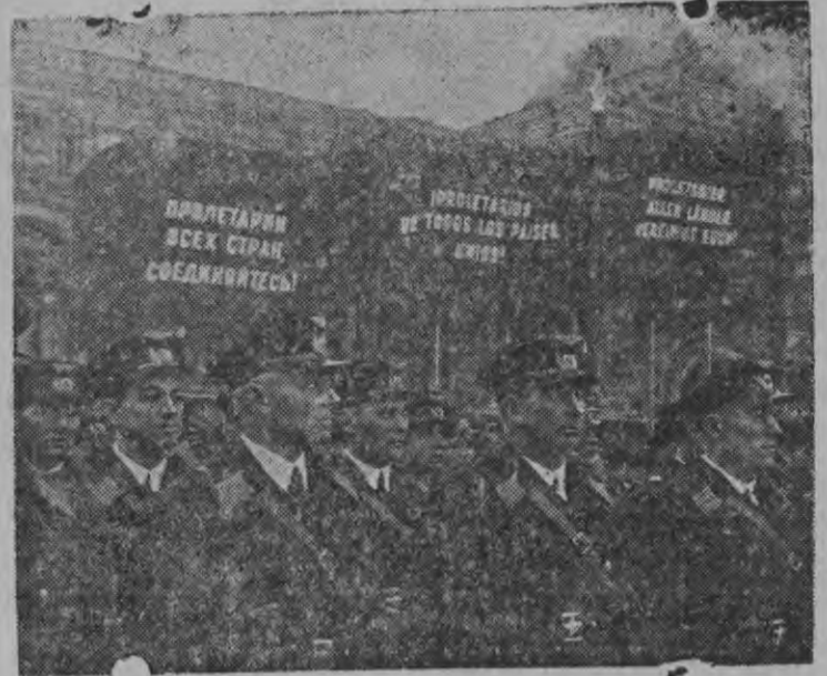
Великой Октябрьской Социалистической революцилэсь 20 ар тырмэзэз праздновать карон. Уж сь мэ Крестьян Горд Армилен частэз парадын—Москваысь Красной площадьюн. Военно—воздушной частёс парад кутскемлэсь азыло Красной площадын.