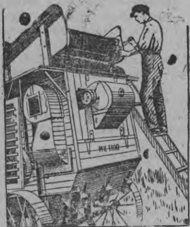
Машинист кутсаськон машина эскере.

Гызмыльтонэз быдтоно. Машинаосты одиг час но жегатытэк ужатоно. Социалистической Чошатсконэз паськыт вöлмытыса Сталинской урожаез, вакчи дыр'ёсы но выль зечлыко октом.