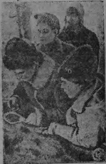
УССР-ысь „Червона украинка“ колхозын чабей видьслэсь потонлыкэ эскеро.