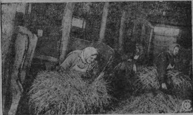
Ленинлэн нимыныз нима колхозын скал'еслэн гид'есазы нуналлы быдэ виль куро вёлдыло.

сылны луонтэм ыль, чыре. Малы озы дышеткись пинал'ёсты савтэмако. Та ужын янгыш луйсьёсты али ик чурит шымыртоно. Донучаев, Тронин но Ившин