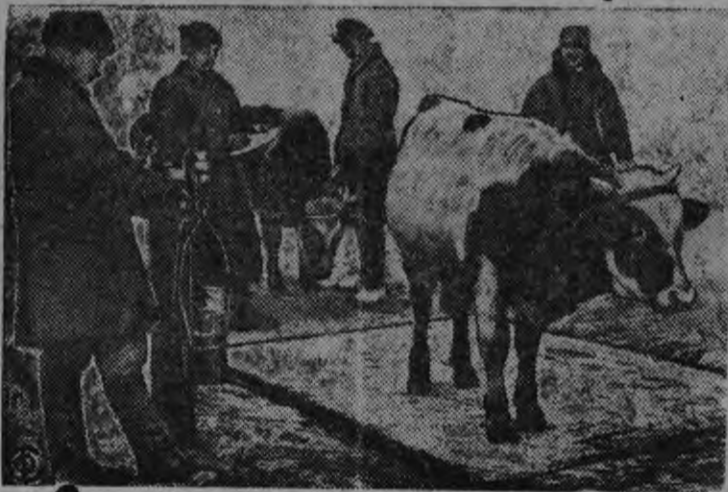
Колхоз'есын племенной пудоослэсь нуналаз кöня будэмзэс мерталляло.

Тини озы Хохряков колхоз вылэ оскыса аслэстыз хозяйствозэ пазяны туртске. Колхоз правлениослы таче уж'есын чурит нюр'яскон нуоно. Колхозник'ес асьсэ хозяйствозэс быдтыса, колхозлэсь кужымзэ лябомыто. Пер.