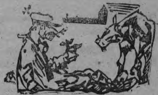
Лошадь: тов. конюх, мне бы помыться, давно ты меня не чистил! Конюх: Зачем тебе мыться, ведь опять загрязнешься.