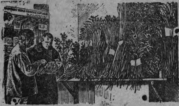
Советы совхоза тросов колхозов хата-лабораторное усытыламын. Суред вылын: хата-лабораторийн портэм растениос пуктыламын.