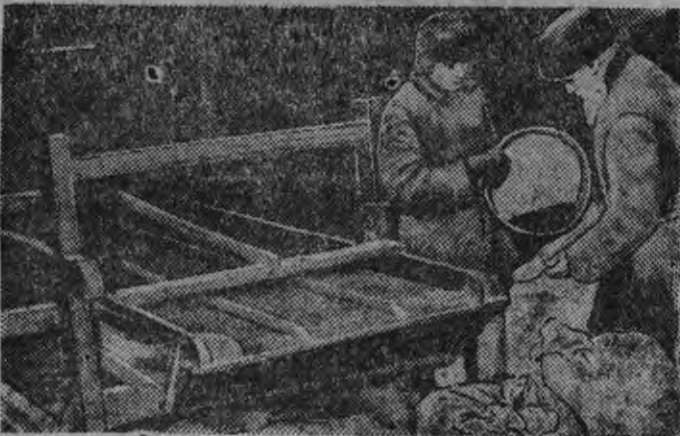
Колхоз „Красный Пролетарий“ (Волоколамский район Московской обл.) полностью обеспечил себя льносеменами. На снимке сортировка на трере льносемян.