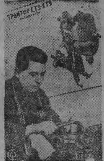
Дебесс МТС-ын тракторист'ёсыз дышето.

Суред вылын: тракторист карбюраторез дышетоко.