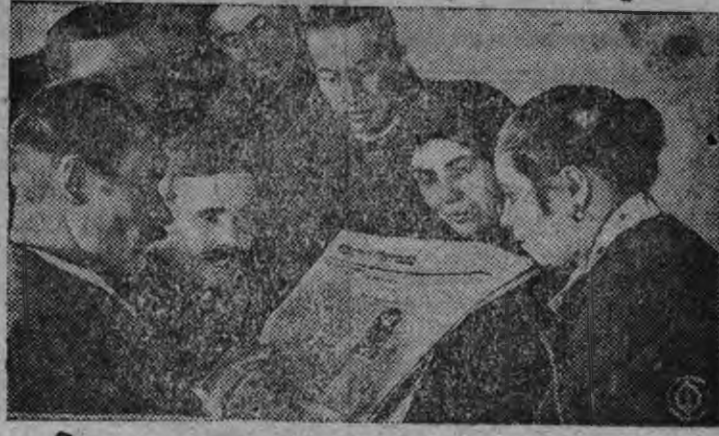
Делегат II всесоюзного с'езда колхозников ударников прорабатывает примерный устав сельхозартели среди колхозников и трудящихся единоличников.