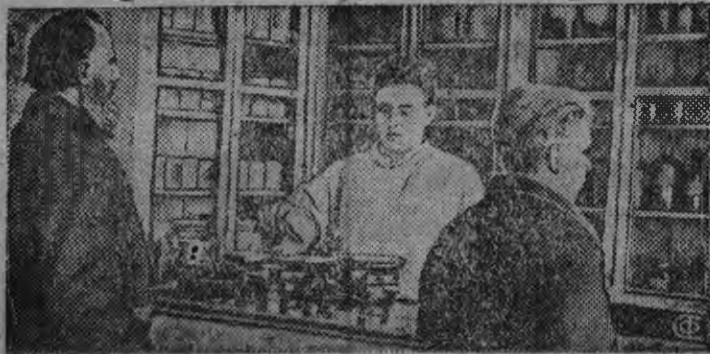
В г. Серде Ивановской области открыта новая ветеринарная лечебница. На снимке: аптека ветеринарной лечебницы.

Поздеев эшлэсь опытсэ районсы вань финактивлы киуштоно. Ипат.