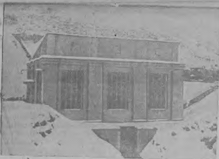
Суред вылын: Казахстаньсы нырысетйез гидроэлектростанция (Буденный лэн нимыныз нима колхоз, Каскелинской район, Алма-Атинской область), Электростанция кылем арын 18 декабре ус'этэмь.

Звеновод'эс звеноеп кивалтэм понна дополнително басьто на звенолэн ужам трудоденьысытыз 2 процентэ. Звеновод'эслы дополнително трудодель начисляться кариське учитывать карыса сое, кызы звено аслэсытыз планзэ быдэстйз.