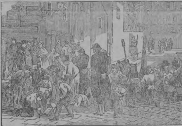
Парижской Коммуналэн 68 годовщинаез

Версалец'ёслы Париже пырыны луиз. Геройски жугиськызы коммунар'ес баррикадаын. Нылкышноос пиос'ёсын чош жугиськызы, нылпиос нуллызы порох но сионюон. 28 мае берпум баррикада быриз. Тьер но Галифе Парижез ужасьёслэн виренызы пылатйзы.