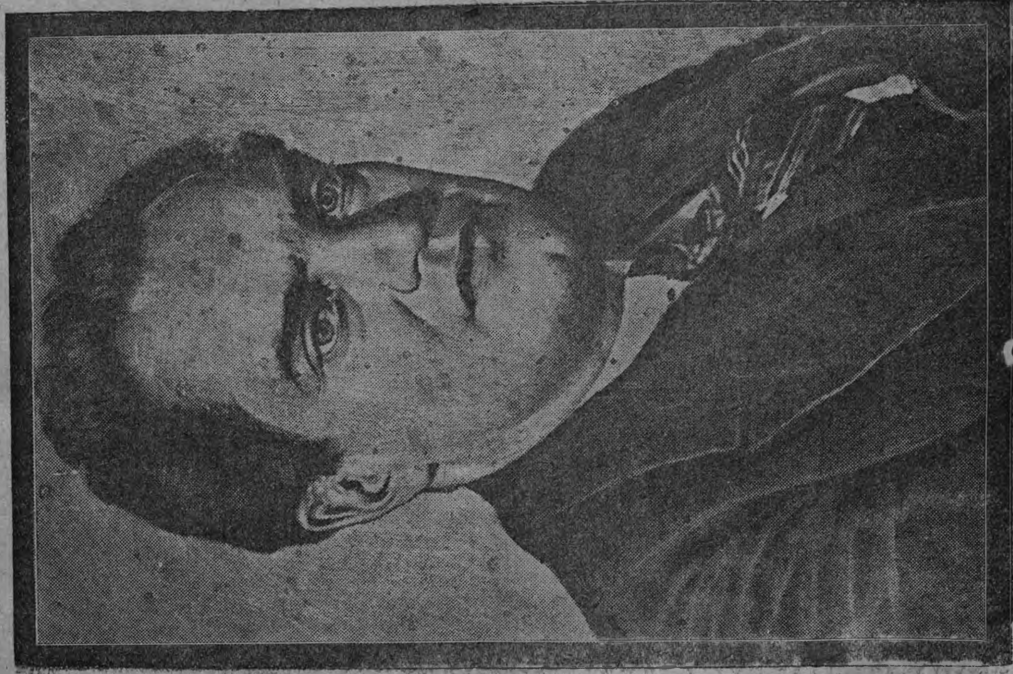
В. В. Куйбышев.