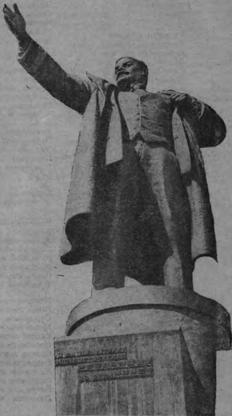
В. И. ЛЕНИНЭНЬ памятник (Ленинградсо финляндской вонзалонть ванссо)