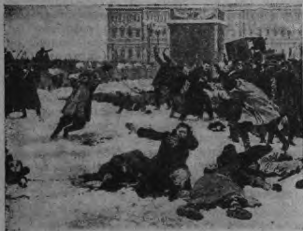
ВЕРЬЦЕСЬ: растрел московонь фабрикасо 1905 иестэ.