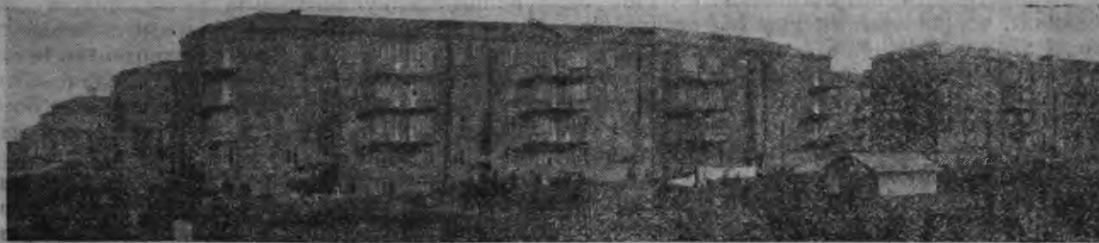
Магнитогорскойсэ 62 тыща рабочейть, 170 тыща эрицят. Ней сруить социалистической город 150-200 тыща эрицянен. Снимкасонт магнитогорской заводонь соцгородонть постройканзо.