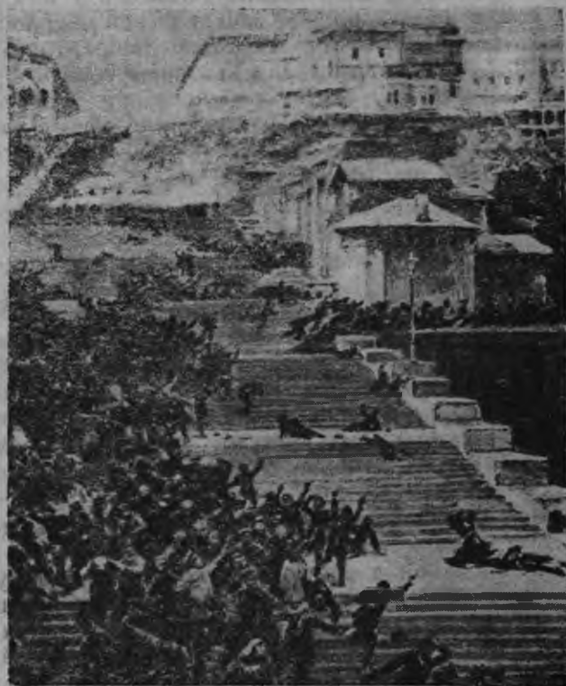
КОЛМОЦЕСЬ: „одессная лестница“, растрел мирной эрицятнень одесской портсо „Потемкин“ броненосецонь востаниянь читнень.