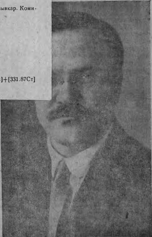
МОЛОТОВ (СКРЯБИН) ялгась (СССР-нь совнаркомонь председатель)