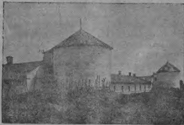
Силосонь башня (совхоз жигули)