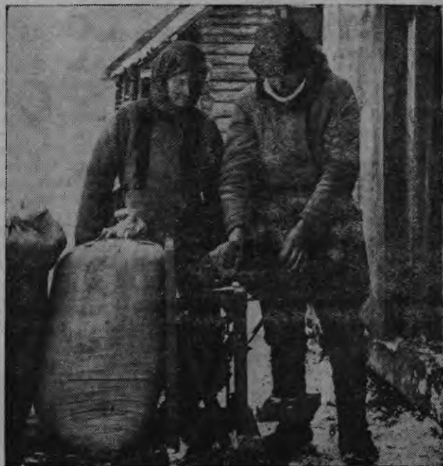
Колхознэ онкстыть анокстыть видьменкст