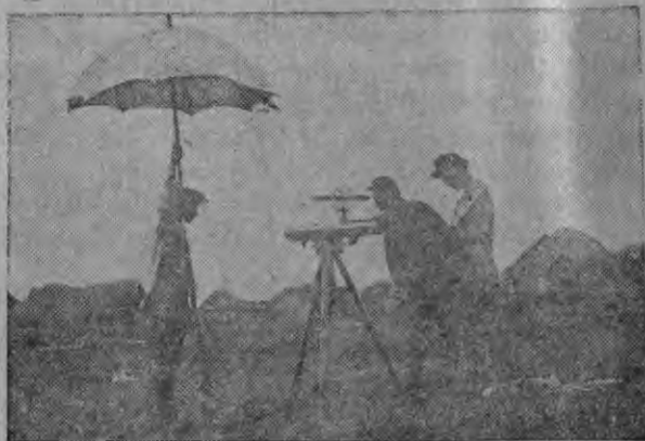
Самарскый лукань таркатнень с'емна