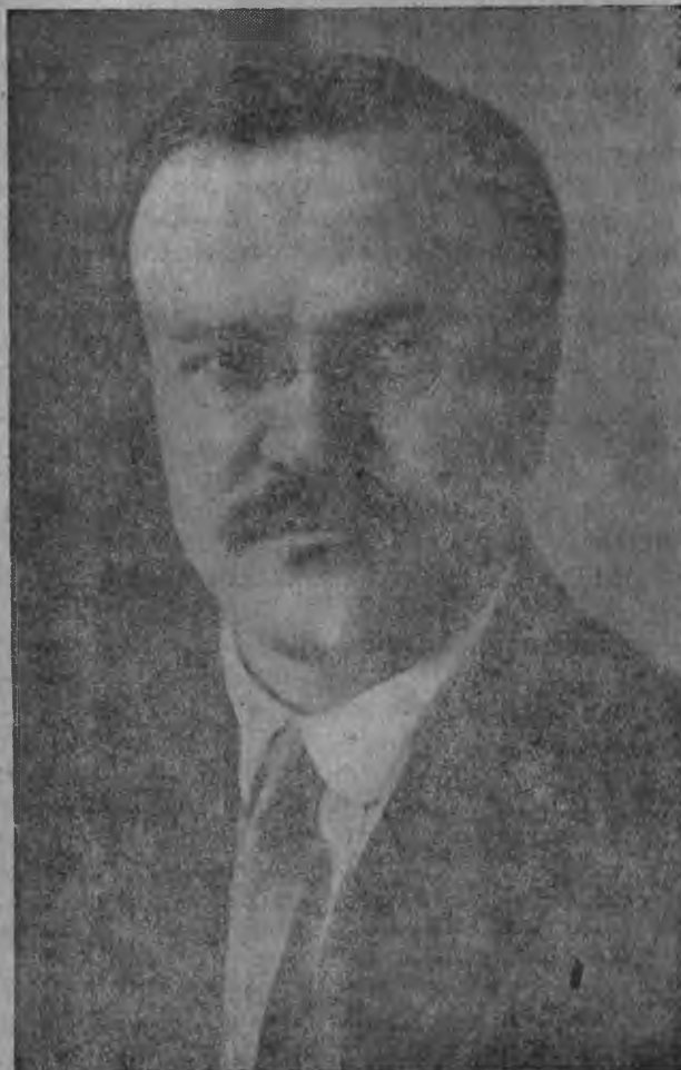
МОЛОТОВ (СКРЯБИН) ялгась (СССР-нь совнаркомонь председатель)