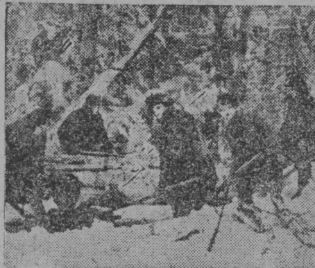
Кулёмдынын муно береговёј рубка.

следуетё кыскывыны, медым лоё тёдчана мукёды, мыј великодержавној шовињизмыс зараза паскёдыгасёс совет правїтельствё чорыда мыждё, петкёдлыны мај став массаыс крепыда кутчыгёма Лёнінскёј националној полїтика бердё, мыј некущом ковтом сорнї оз вермы зугны братскёј јїтёдроча комїја костыс.