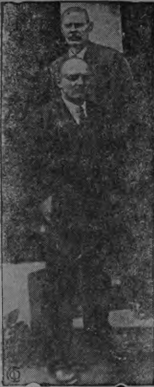
Снимкасонть: Ленин ды Горький Коминтернань омбоце конгрессэ 1920 иестэ