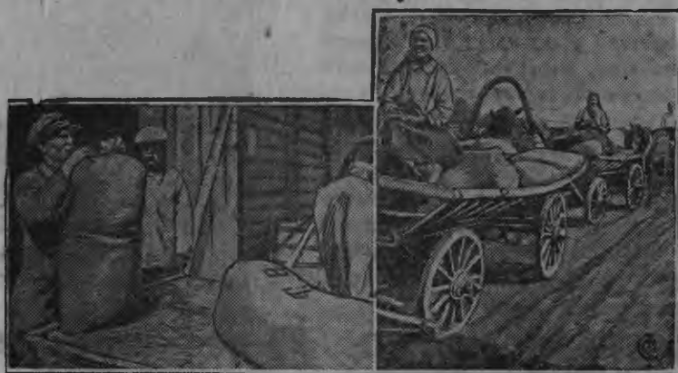
СНИМКАСОНТЬ: Керш кеде енсо—ускить элеваторов суро. Вить кеде енсо-чамдыть суро.

ВКП(б)-нь райкомтнень эряви кеместэ вачкудемс те оппортунистманть ланга ды карматомс эрва колхозонть седе курокесто прядомс сокамо плантнень.