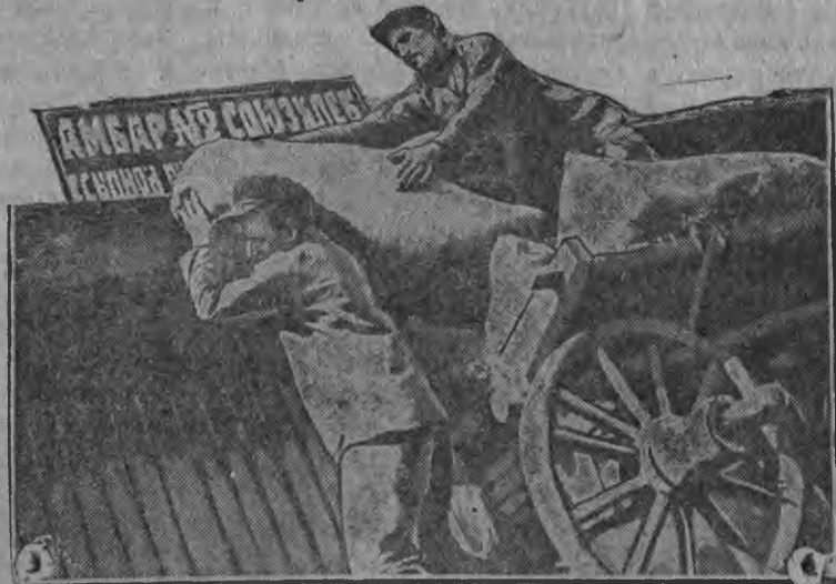
СНИМКАСОНТЬ: Усманской райононь „Красный колос“, колхозось сыпной пункт чамды суро

Октябрь ковонь 25-це чинть самс ударной штурмасо ПРЯЦЫНЕК велькска сюронь ды эмежень анокстамо плантнэнь!