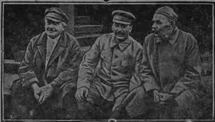
Енукидзе, Сталин ды Горький