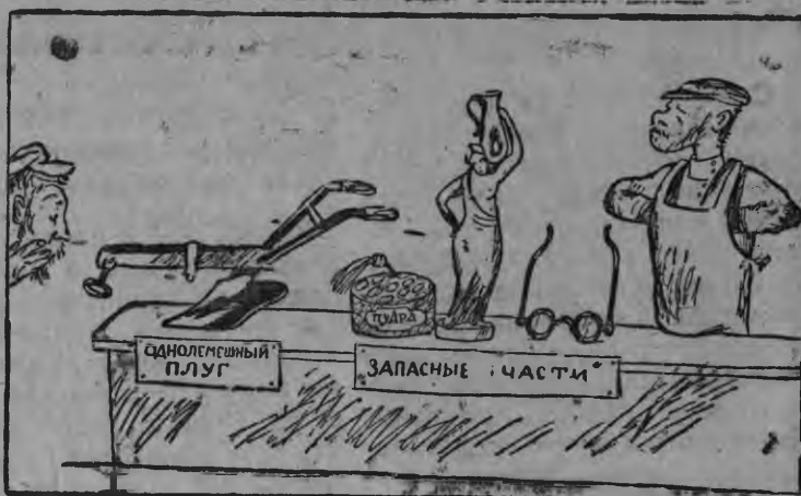
КООПЕРАТОРОСЬ: „Башка съкамонзо „запасонь“ пелькс стэме а микшнесынек“...

Ламо тарнава аэрявикс товартнень вийсэ макснесызь рамсицятнень эрявикс товартнень марто