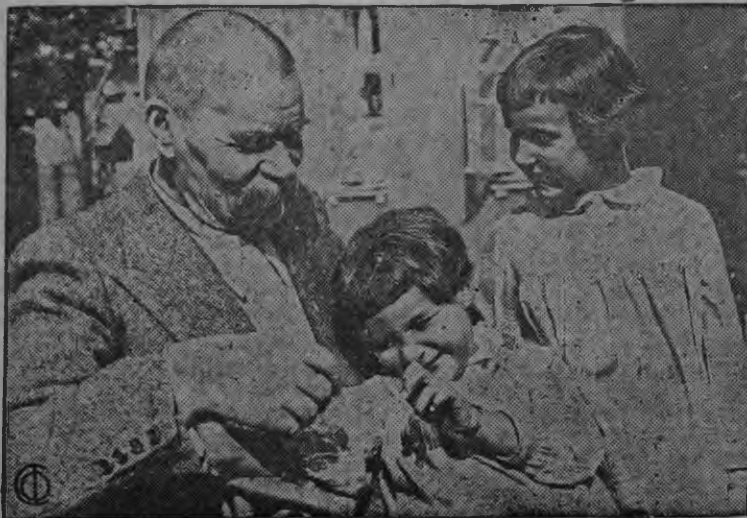
М Горький нуцьканзо марто

“СЯТКОНЬ, “ЛЕНИНЭНЬ КИЯВАНЬ” ДЫ “ЭРЗЯНЬ КОМУНАНЬ” РЕДАКЦИЯТНЕ.