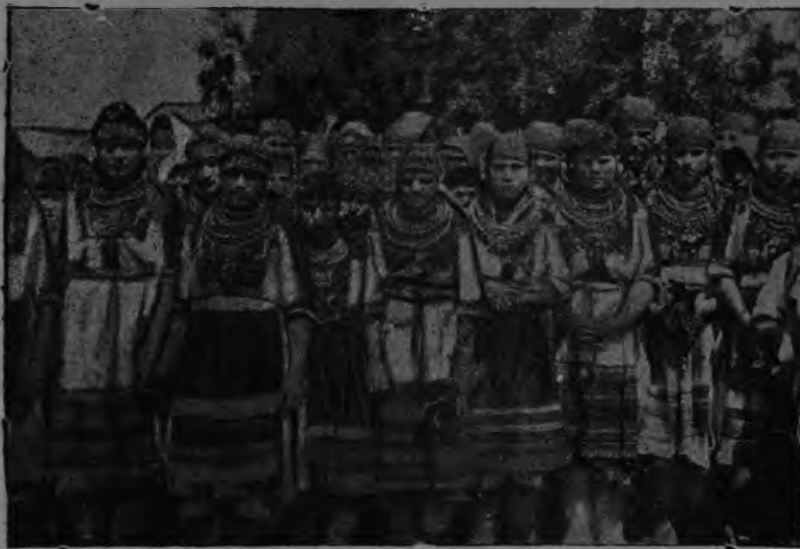
Эрянь аватне ды тейтерьтне пуромсть делегаткань кочкамо.