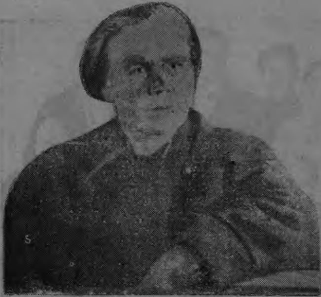
Глухова ялгась эрзянь коммуниань „III-де Интернациональнень“ председателезэ. Коммунась Ульяновской округсо.

заемонтькак аватне кува-кува сермацтыть седе парсте,