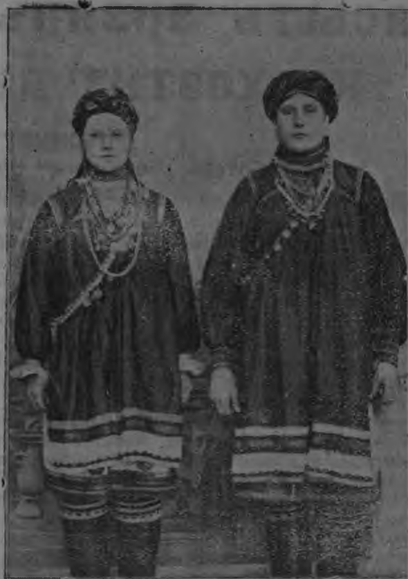
Кодат сыть тонавтнине эрзя мокшонь рабфакс.