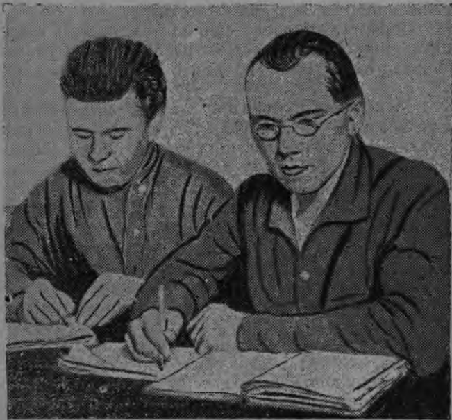
Комуниверситетэнь эрзя-мокшонь отделениянь студентя работгыть.