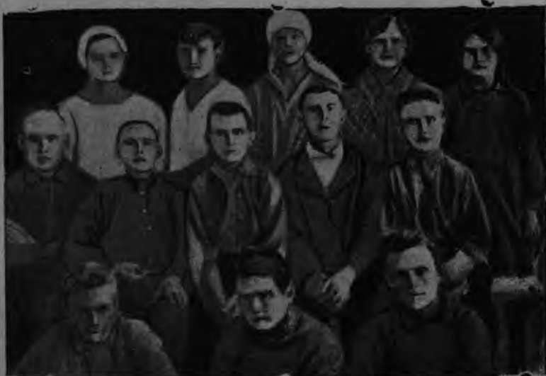
Ульновской эрзя-мокшонь педтехникумс састь одт тонавтицят.