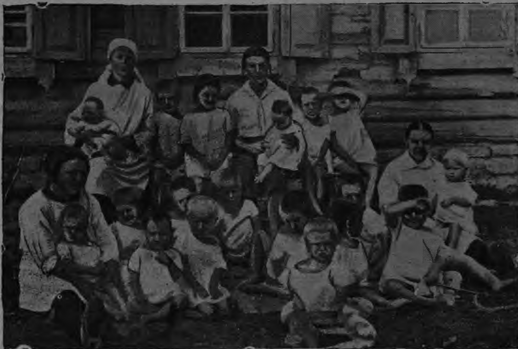
Якстере Ключевка велень эйкакшонъ яслят. Бугурусланск. округ. Кивель-Черкасс. район.

Батракт ды беднякт, илиньк стувт, што машинась ащи паро орудиякс кулаконъ карчо баруцямсто. Машинась пурнэ беднотанть куцяс.