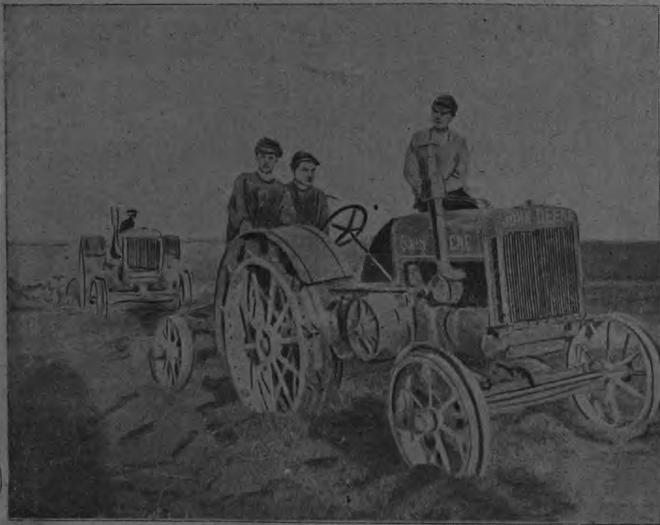
Колхозниктне анокстыть соказь-мода лов алов.

Эрзянь сокицянь общественно-политической журнал.