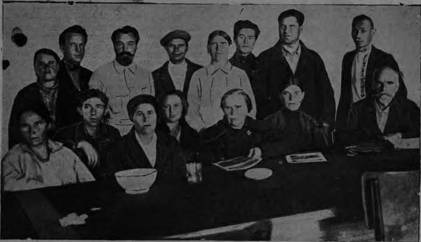
Эрзя—мокшонь делегациясь нацмен-аватнень эрямост ды роботаст вадрылгавтоманть кувалт областной васень совещаниясо.