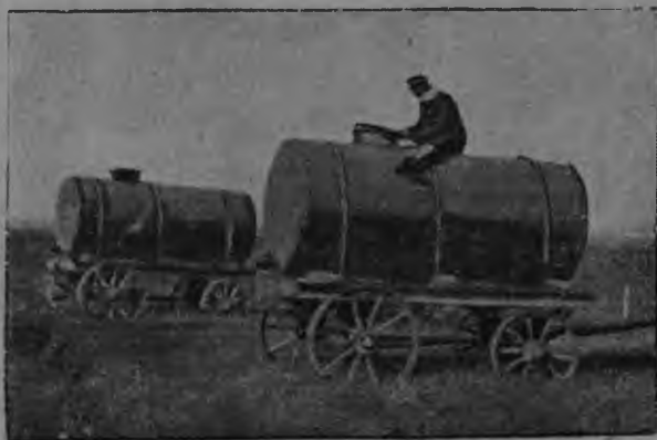
Неть боцькатнень эйсэ кирьдить ведь паксясо роботамсто совхозга.

Эрва ломанентень, эряви думазевемс теде. Пек седе паро ули бути попнэнь таркас ярмактнэнь ды суронть нолдамс тракторонь рамамос. Поптоми ды церкувавтомо картасо налксиматне ды винадо др симиматнеяк седе пек курок лоткавтовить.