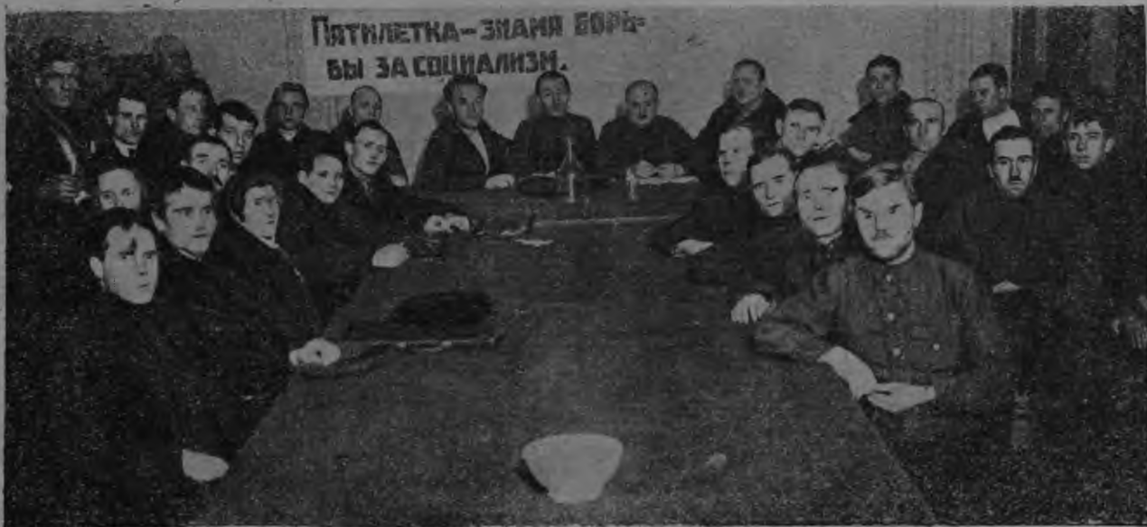
Мокшерзьянь делегациясь нацменпартработниктнэнь краевой 2 совещаниясьньть.

Од училинятнэнь, техникумтнэнь, Комуниверситетэнь Мокшерзьянь отделениянь панжумась— те весе истяжо корты минек покш достижениятнедт. Яла теке совещаниясь мерсь, што неть достижения-неде а ламо. Мекс? Вана мекс. Ней велева виевстэ моли социазмань лувонь строямость. Те тевесь вещи пек ламо эрва кодат кеме роботникть. Секс совещаниясь аравтсь, што эряви эшо седе пек вилгавтомс велесэ социализмань строиця работниктнэнь анокстамоньть.