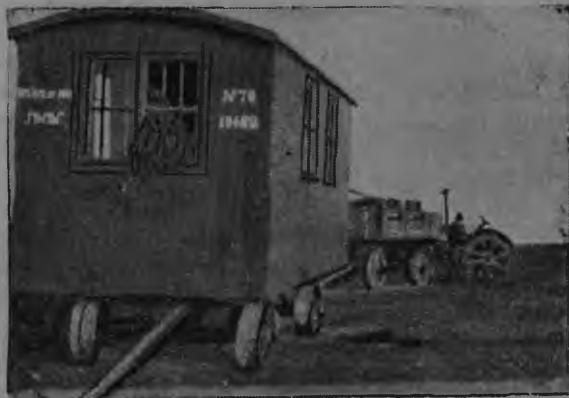
Неть кудо-вагонтиэнь эйсе совхозниктне эрять кизна паксясо роботамсто.

Комсомолецтнэнь эрявить теемс ударной бригадат ды кармакс пек виевстэ бороцямо пазнэны озноматнень ды попонь маньчечатнень карчо. Эряви толкувамс народонть, што баягатнень церкувапрясо ацимадост ды шумост кунцулумадо-пек паро уле максомс сынст заводс, косо теить эйстэст в/х ды лия машинат. Ламо велера арась школанок ды клубонк. А путовить покш кудот сынст туртов, а церкуватне пек парсте можналь теемс школак ды клубокс, косо сынст ендэ уливель покш лезэ. Эряви школава ды ловнома-кудова виевстэ толкувамс народонтень, што роштуванть теязь поптнэ ды сурпавтнэ, што иисусось знярдоак арасиль.