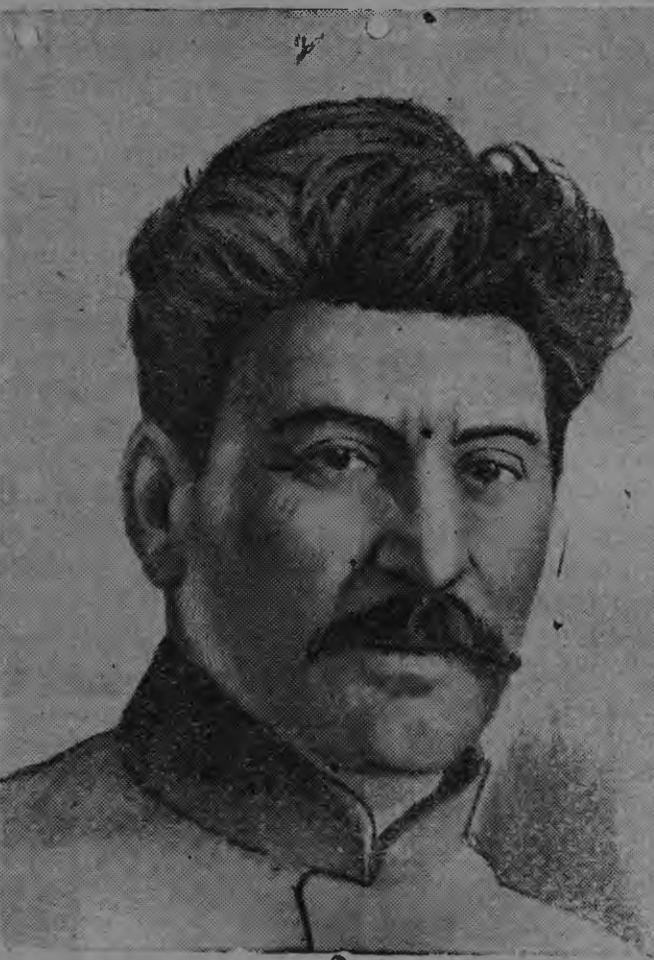
И. В. СТАЛИН ялгась

1920—23 иетнестэ Ста- лин ялгась работась рес- публикань Реввоенсовет- энь членке. 1922 иестэ и