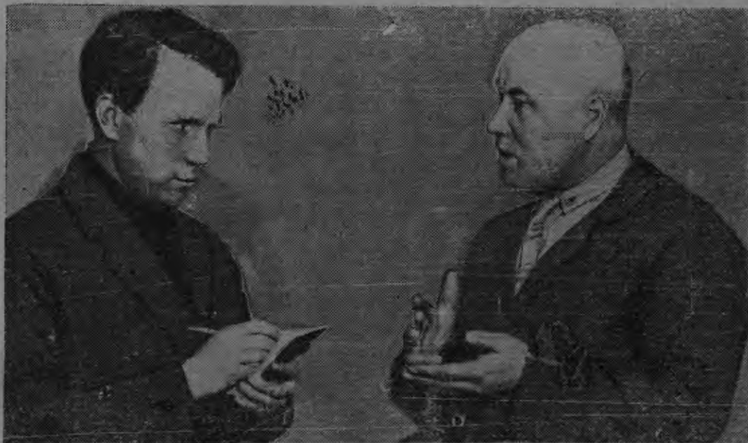
Андрофагин ял. корты колхозной строительствадонть кусторой об'единениянь председ. Мурзин ял. (вить кедь енесь) марто